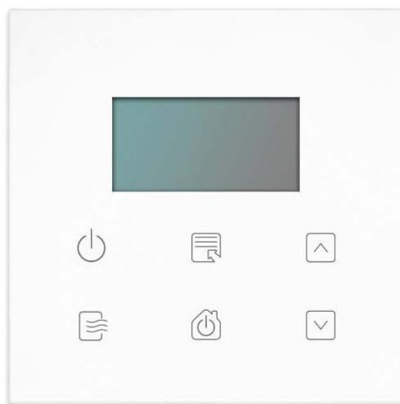
OT - Clima