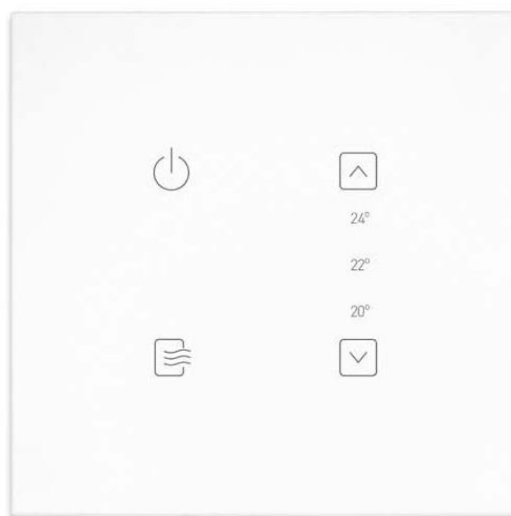
OT - Termo